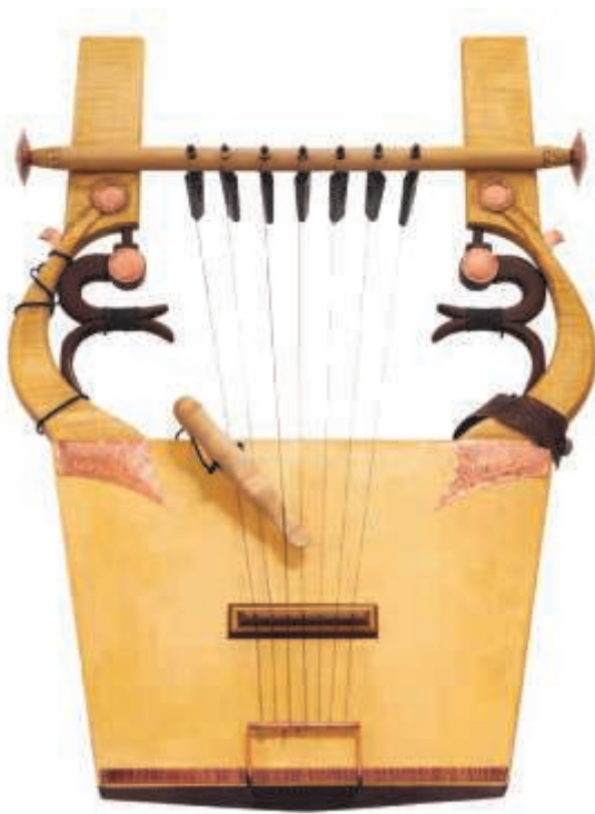
Reconstructie van een Griekse zevensnarige kithara